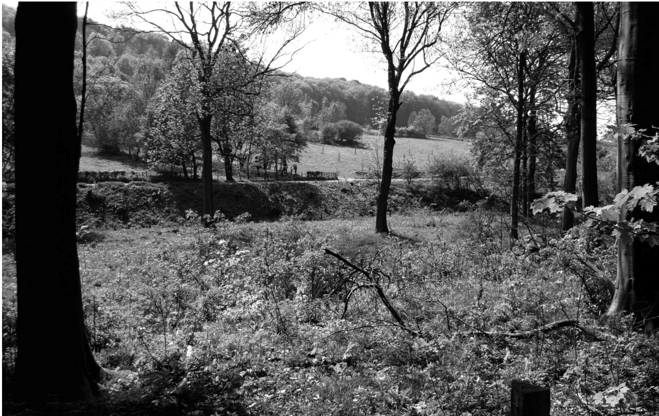
Middenbos, grote bomen en open plekken, langs de rand hakhoutbeheer, nabij het "Krüingelwègske".

randen). Daarnaast is het Savelsbos van groot belang voor de meervleermuis, de ingekorven vleermuis en de vale vleermuis als overwinteringsgebied. Doel is dan ook het behoud van de omvang en de kwaliteit van het leefgebied van deze populatie. In totaal is nu een oppervlakte van 360 ha aangewezen als beschermd natuurgebied en cultuurlandschap. Dit is aanzienlijk