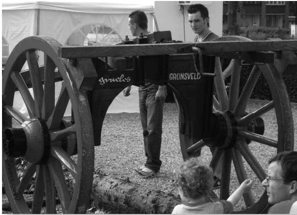
'De trêkbal' tijdens het inhalen van de mei-den in Rijckholt.

Het wiel was op tijd gereed zodat het inhalen van de mei-den met een veilige mallejan kon plaatsvinden.