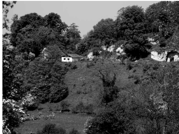
Herstel en instandhouding kalkgrasland Riesenberg, gezien vanaf "d'n awwen Êkkelderwäg".

De eerste twee factoren zijn niet of nauwelijks te beïnvloeden. Wat overblijft is de derde factor: de menselijke en dierlijke invloeden. Ik noem hier bewust ook de invloed van dieren omdat naast het vee van vroeger en nu, ook wilde