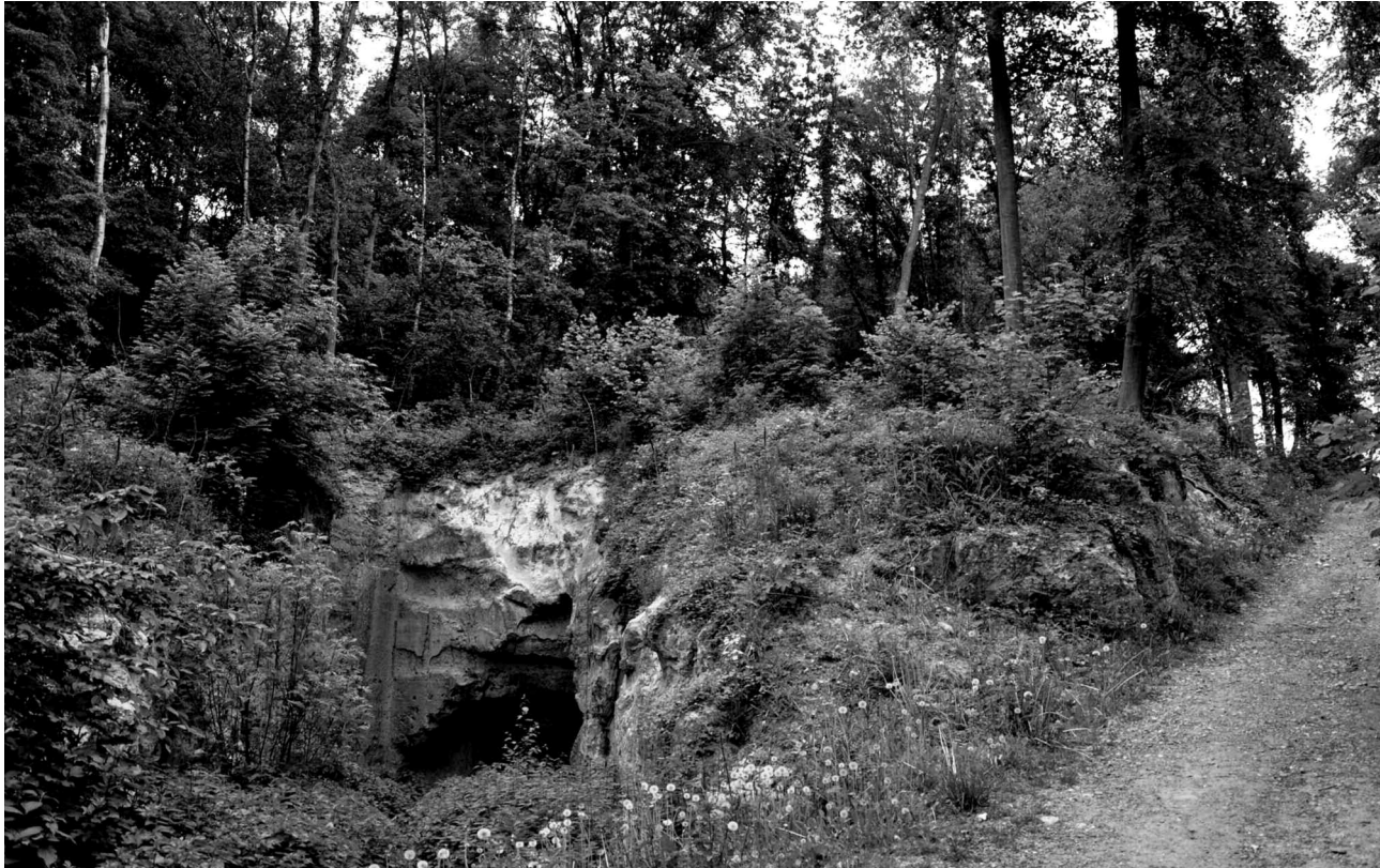
Kap ten behoeve van behoud zeldzame soorten als vingerzegge en ruig hertshooi langs "Saovelswäg".

graslanden en soorten als het vliegend hert, de eikelmuis en de geelbuikvuurpad, ook op de langere termijn kunnen blijven voorkomen. Op enkele plaatsen worden maatregelen getroffen voor het in stand houden van zeer zeldzame soorten als amandelwolfsmelk, vingerzegge en ruig hertshooi. Hiervoor zijn specifieke instandhoudingsdoelstellingen ge-