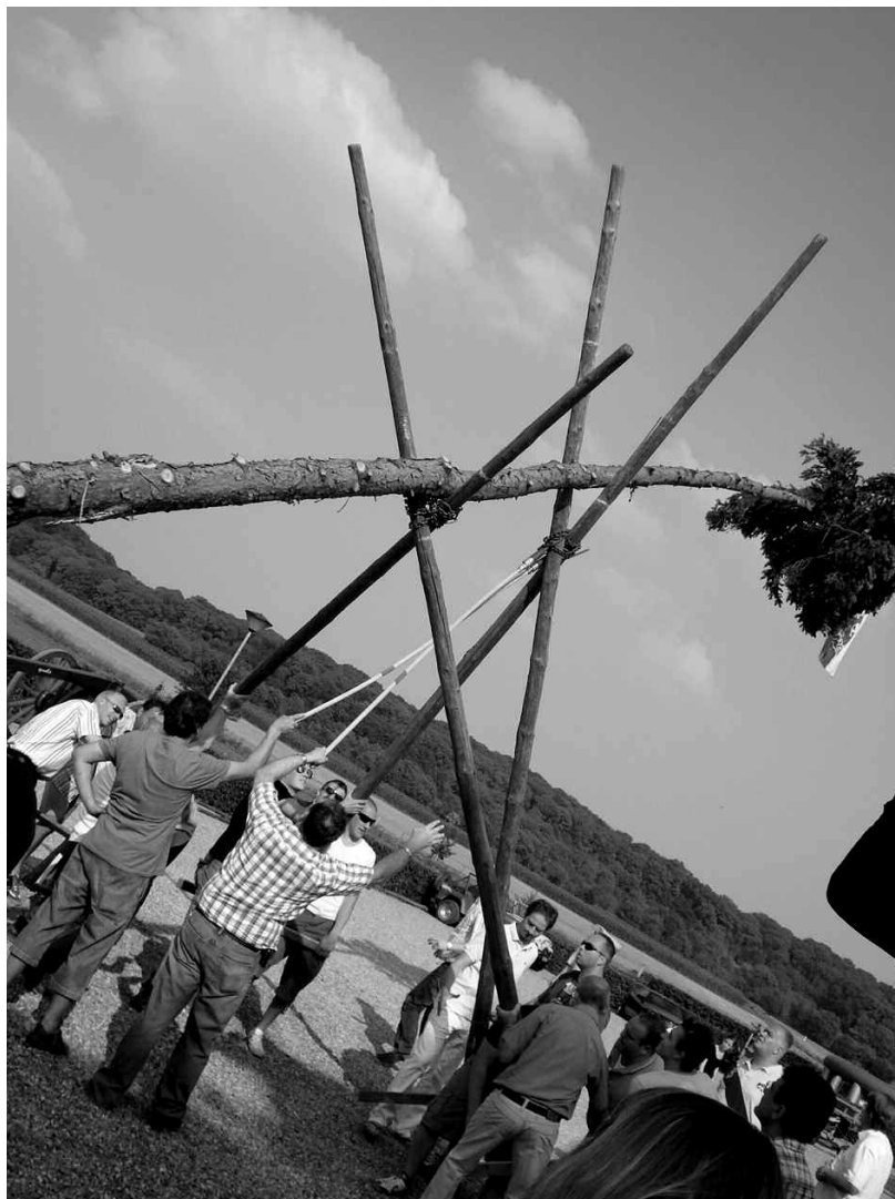
Mei-den in Rijckholt.