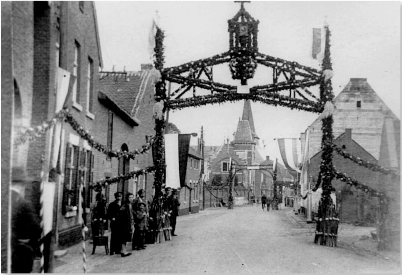
Bronkversiering begin vorige eeuw.