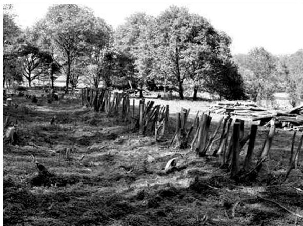
Herstel oude haag en voorbeeld van hakhoutbeheer, in de buurt van "Niésbos".

beheermaatregelen uitgevoerd hoeven te worden. Er kan ook gekozen worden voor behoud van een deel van het cultuurlandschap van vroegere jaren. Denk aan hakhoutbos, middenbos, kalkgraslanden, mantel- en zoomvegetaties, hagen, graften en misschien zelfs nog wel heide. Dit zijn allemaal elementen die uitsluitend door menselijk handelen zijn ontstaan en ook alleen maar door menselijk ingrijpen in stand gehouden kunnen worden. En dit laatste is waar nu aan gewerkt wordt door de beheerders van Staatsbosbeheer: het behoud van een deel van het vroegere cultuurlandschap! Hiervoor is gekozen omdat juist door deze elementen veel zeldzame plant- en diersoorten kunnen overleven. Om dit te realiseren zijn uit verschillende bronnen, waaronder de Europese Unie, subsidies beschikbaar gesteld. Op onze vraag of