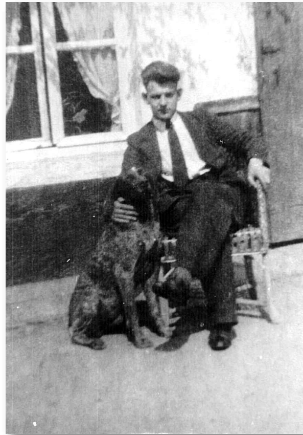
1950. 'Op de cour' van het ouderlijk huis