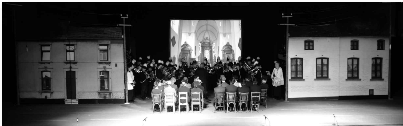
Het decor voor "Herriemenie"

gerenoveerd worden. Daar is het afgelopen jaar hard aan gewerkt. Er is nu een vergaderruimte annex kantine, schilder/timmerwerkplaats, werkplaats voor ijzer- en staalwerk. De bovenverdieping moet nog geschikt worden gemaakt voor jeugdactiviteiten.