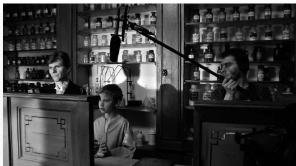
Filmopnames in het museum

Eugène Dubois werd in 1858 geboren in Eijsden als zoon van een apotheker. Het was één jaar voordat Charles Darwin zijn evolutietheorie openbaar maakte. In zijn jeugd vertoefde Eugène veel in het Savelsbos en op de Sint Pietersberg, waar hij intensief speurde naar fossielen. Hij studeerde medicijnen in Amsterdam met de bedoeling zijn vader op te volgen. Na zijn afstuderen ging zijn interesse uit naar de anatomie en de afstammingsgeschiedenis van de mens. De ontdekking van resten van Neanderthalers in Europa stimuleerde zijn interesse. Eugène werd een wereldberoemde anatoom-paleontoloog. In het streekmuseum van Grueles staat de apotheek van zijn vader. Op 2 mei werden daar opnames gemaakt voor de televisiedocumentaire "De ontbrekende schakel" over het leven van professor Eugène Dubois. De documentaire zal in oktober worden gepresenteerd in het Natuurhistorisch Museum te Maastricht.