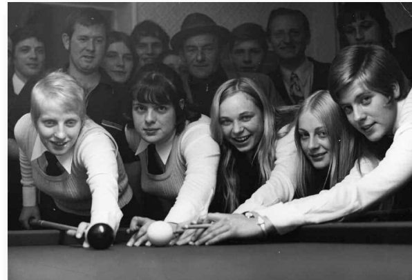
Het roemruchte damesteam.

Modern en geëmancipeerd was de vereniging ook, want in 1972 werd door een volledig uit dames bestaand team deelgenomen aan de bondscompetitie. Dit was uniek in de biljartwereld, zeker omdat deze dames een behoorlijk moyenne speelden en maar moeilijk te kloppen waren.