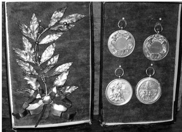
Opschrift lauwerkrans: Harmonie St. Cecilia Hoensbroek. 1856-1927. 2den prijs eerenwedstrijd.

In haar 175-jarig bestaan heeft de Koninklijke Harmonie van Gronsveld regelmatig meegedaan aan concoursen. Zo nam zij in 1925 deel aan het concours georganiseerd door Harmonie Heer Vooruit, waar een 1e prijs en een 1e prijs bij de erewedstrijd werd behaald. Een erewedstrijd was een wedstrijd tussen alle deelnemers van een concours die een 1e of 2e prijs behaald hadden. Alle korpsen moesten hetzelfde stuk spelen en dit werd apart gejureerd. Bij het concours te Hoensbroek in 1927 werden een 2e prijs in de marswedstrijd, een 1e prijs in de 1e