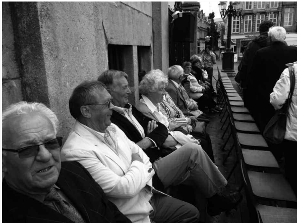
Leden van de sectie Streekmuseum voor het stadhuis in Maastricht

Maastricht om vanaf het stadhuis de optocht te komen bekijken.