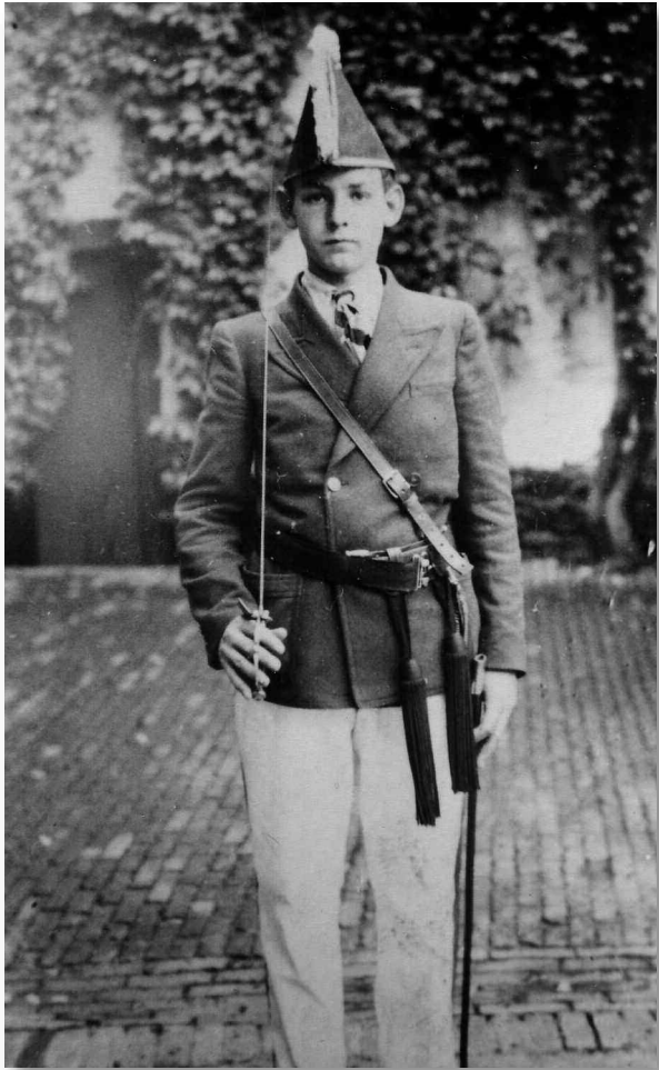
1939. Majoor van jeugdschutterij 't Brook