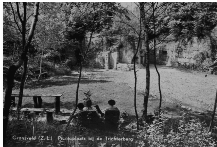
Prentbriefkaart van de "picnicplaats bij de Trichterberg", begin jaren '60

In de jaren 1958-1959 werd een nieuwe toegangsweg uitgehakt. Die doorbraak hing samen met de inrichting van de groeve als parkeer- en picknickplaats. Tegenwoordig is de groeve alleen voor wandelaars toegankelijk.