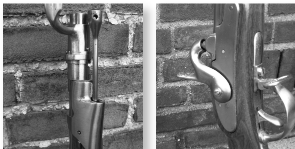
Bovenstuk en trekhaak.

De geweren van de schutterij van Gronsveld zijn antiek. Het zijn musketten. De naam is afgeleid van het Latijnse Musca (letterlijk 'vlieg' of 'pijl'). Ook de naam musketiers is hiervan afgeleid. De eerste musketten werden rond 1600 gefabriceerd in Engeland en Frankrijk. De geweren moesten met een brandend lont worden ontstoken. Omdat de geweren zwaar waren, werd de loop in een vork gelegd (fourchette). In Frankrijk werd na 1700 voor het eerst gewerkt met een ontsteking met vuursteen. Bij regenachtig of koud weer werkte de vuursteen echter minder goed. Later werd uitgevonden dat een (droog) percussiedopje, een slaghoedje, zoals ze thans nog gebruikt worden, beter werkte. De soldaten maakten hun ronde loden kogels zelf met een speciale