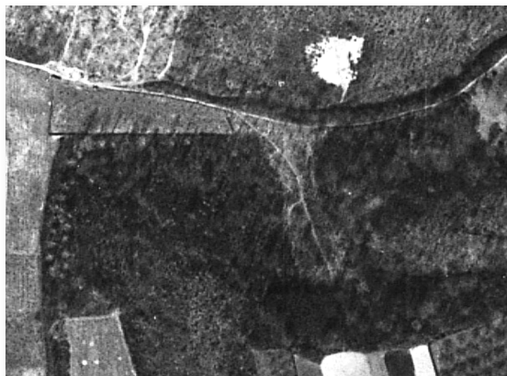
De Sjaopwegskes op een luchtfoto uit 1947 (midden op de foto). Linksboven de inham van het Capelaens boender. Ten noorden van de grub het open terrein van de Zure Dries (witte vlek).

aan weerszijden van het pad tussen de Scheggelder en de Steenberg. Dit pad was een oude trekroute van schaapsherders, door een zijdal van de grub. De brede en kale bermen zijn in de loop van de 20e eeuw verdwenen. Slechts enkele knotbomen markeren nog de voormalige breedte van de doorgang.