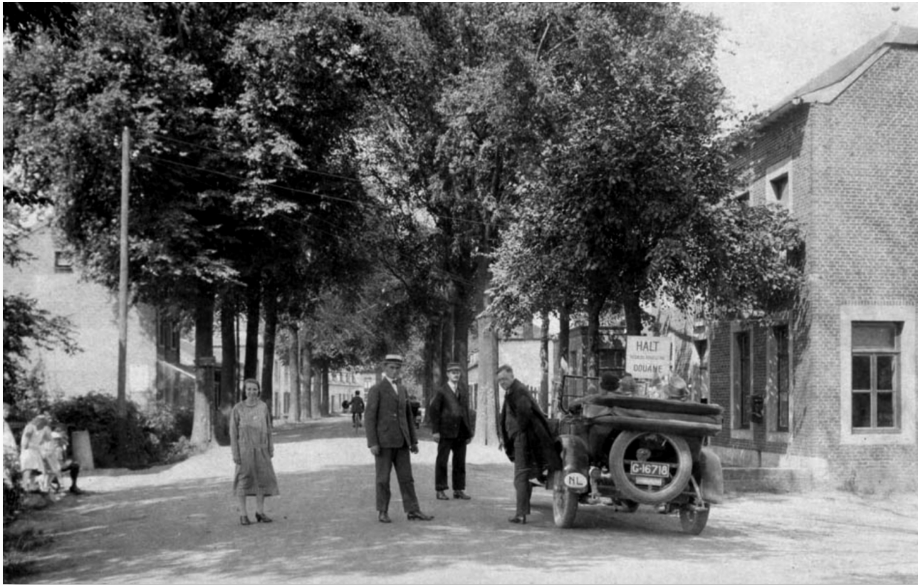
De grens aan het Withuis in Eijsden omstreeks 1910.