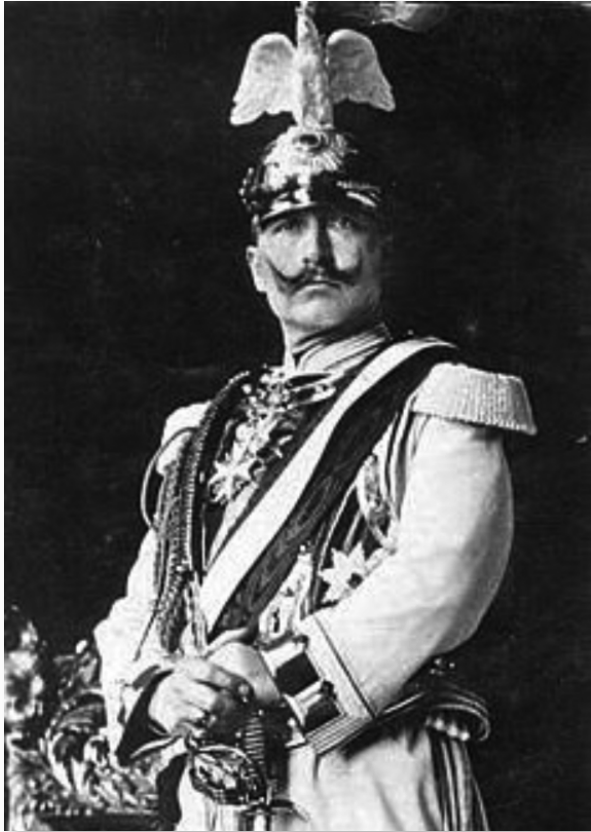
Keizer Wilhelm II.

bevielen en gedroeg zich in internationale kwesties uitermate tactloos. Hij droomde van een eigen Duits koloniaal rijk. Door zijn agressieve uitlatingen begon in Europa een wapenwedloop. Hij had een grote voorliefde voor militair vertoon en uniformen.