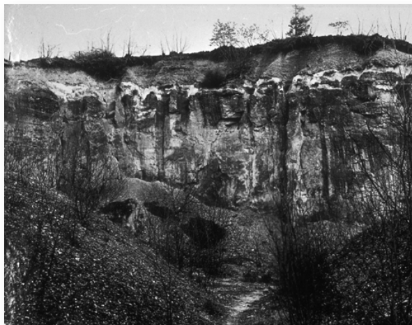
Trichterberggroeve kort na de afgraving.

Tijdens de Eerste Wereldoorlog werd de Trichterberggroeve in dagbouw geëxploiteerd. Langs de Eckelraderweg stond een kalkoven (vooraan bij de slagboom), waarin ook losse mergel uit de tegenoverliggende Dolekamers werd gebrand. Tijdens een inspectie in 1927 bleek dat de onderaardse gangen bijna volledig waren afgegraven. Een foto van A. de Wever, vermoedelijk gemaakt in dezelfde tijd, toont een volledig kale rotswand.