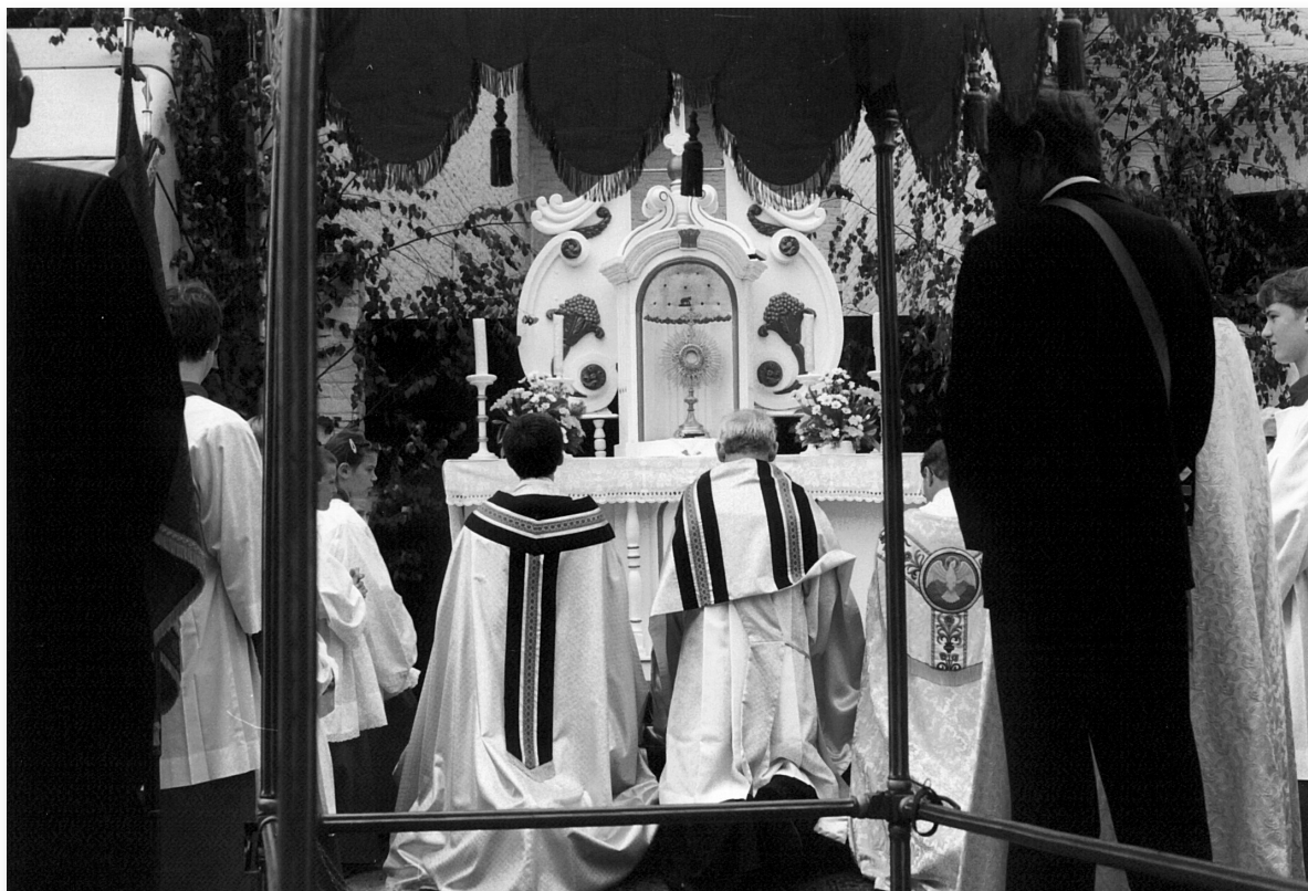
Bij de voor- en titelpagina: Rustaltaar bij bakkerij Van de Weerd.

Een uitgave van de Stichting Grueles | september 2012 | jaargang 32 | nr. 3