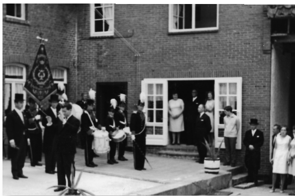
1967. Op de cour. De harmonie brengt na de Sacramentsprocessie haar voorzitter naar huis.