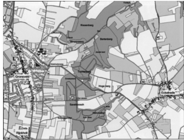
Toponiemen in het Savelsbos die in de tekst genoemd worden.

Verder oostwaarts van 'de berg' kom je bij een smal en diep ravijn. Dit opmerkelijke "ravin profond, qui longe cette partie du bois, porte encore aujourd'hui le nom Gorge de l'Orient" schreef C.L. Caumartin (1864). Een betere vertaling van wat men zei kon hij niet geven. Aanmerkelijk slechter is de naam Jooste keel, die berust op een verbastering van het dialect. Het ravijn ten oosten van Gronsveld heet, zoals plaatselijk wordt gezegd, de Oesjtekèl. Letterlijk de oostelijke kèl of keel. Het toponiem keel duikt in Zuid-Limburg vaker op en is afgeleid van het middeleeuwse woord cûle . Tot op zekere diepte betekenen kuil, keil, keel, keul, koul en koel allemaal hetzelfde (eigenaardig, een geul is een flauwe cûle ). De aanduiding Oesjtekèl benadrukt de ligging én de toestand. Hier vinden we geen onderhouden grub, maar een nauwelijks begaanbare diepte, een natuurlijke kuil.