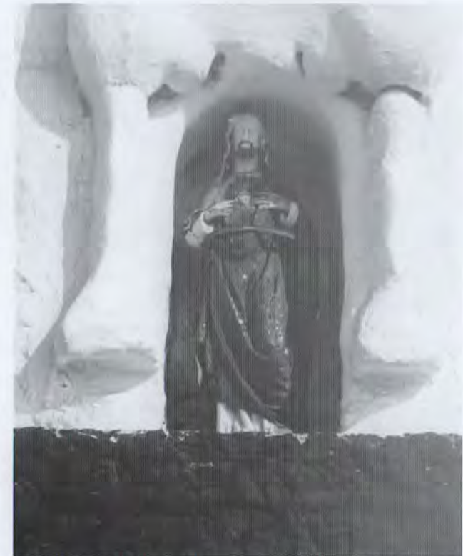
H.Hartbeeld boven de poort van Rijksweg 71.