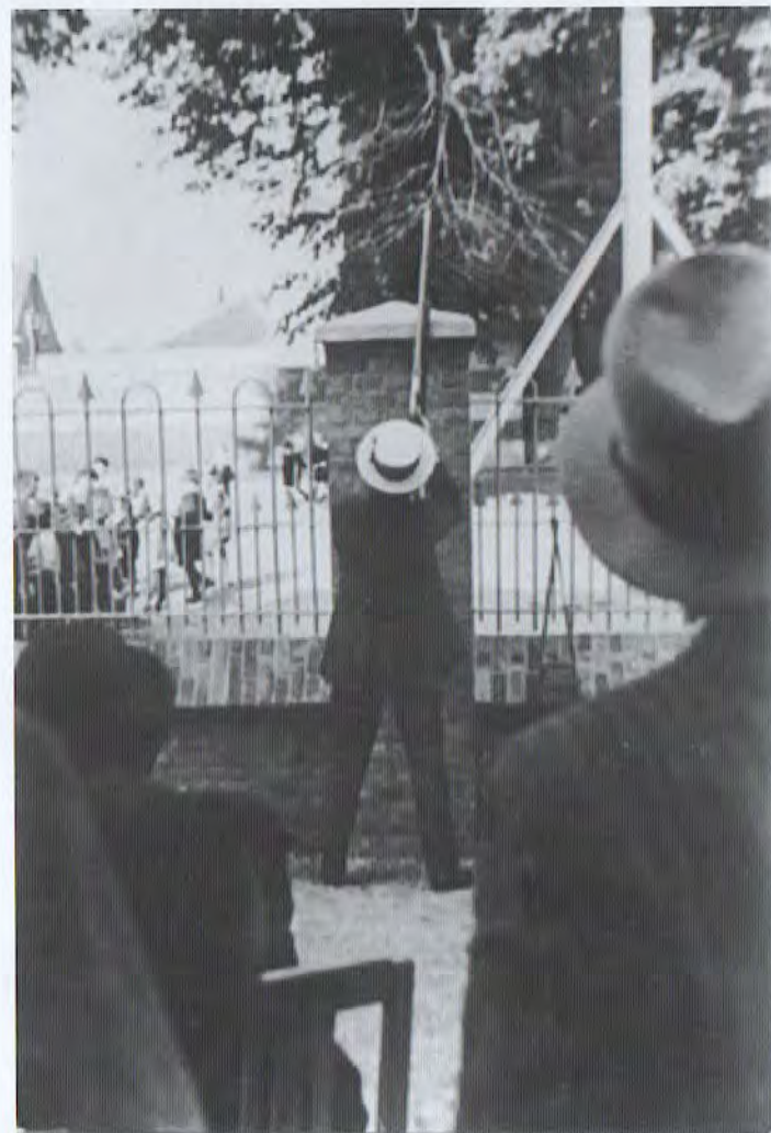
In de jaren twintig van de vorige eeuw werd vanaf het schoolplein richting kerk op de vogel geschoten. Het hek van het schoolplein werd als affuit gebruikt.