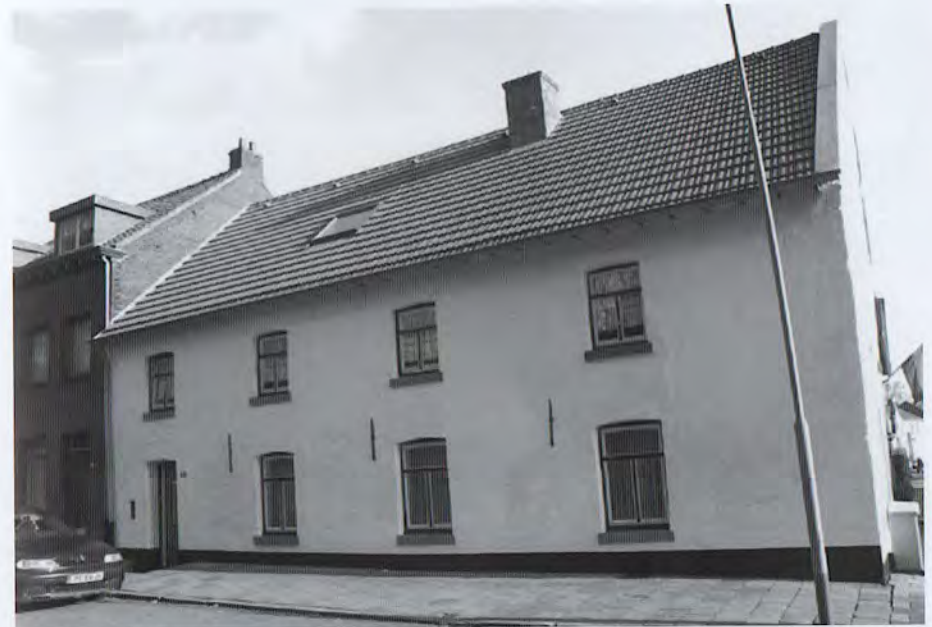
Het ouderlijk huis zoals het er nu uitziet.

totdat het werk klaar was. Zoals in elk gezin was werken het hoogste goed in die tijd. Zjang zei steeds: “De môs wërke vuur noets te sjterve en lève vuur aldaog te sjterve”. De spaarzame vrije tijd werd in het gezin gevuld met handwerken en breien. Zjang vond dat effectiever dan bijvoorbeeld kaarten. Ofschoon hij graag een kaartje legde bij Doijen (Sjtéske) hield hij zijn kinderen liever van het kaarten af met de woorden: “Dao koëme de preentsjes van d’n duvel weer oppe taofel”. Zjang had altijd heel eenvoudig en sober geleefd. Hij gaf niet onnodig geld uit, begrijpelijk met zo veel kinderen. Hij dronk nauwelijks en rookte niet. Toen hij 65 werd, vond hij dat een goed moment om een sigaar op te steken. Het huis van Zjang was “de zeuten iénvaal”. Altijd zat de tafel vol en niet met familie alleen. Veel dorpsgenoten zochten het huis op waar altijd wel iets te doen was. Zjang was streng, rechtvaardig en op zijn manier toch ook weer tolerant. Feesten waren aan hem niet besteed. Hij respecteerde de zondagsrust; hij was geen verenigingsmens. Wel was hij lang bestuurslid van de Boerenbond, waarvoor hij regelmatig naar Roermond moest. Ook was hij tot 1964 lid van de Raad van Bestuur van de Boerenleenbank (thans Rabobank). Hij ging niet graag het dorp uit, een paar uitzonderingen daargelaten. Een van deze uitzonderingen kwam door een verzoek van zijn vriend Pierre Schrijnemaekers. Pierre was