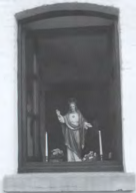
Processieversiering. Een Heilig Hart-beeld is een beeld van Jezus Christus die zijn hart toont als teken van zijn liefde voor de mensheid.

's Middags was de vésper , waarin het Tantum Ergo werd gezongen en de rozenkrans gebeden. Vooral die kerkgang 's middags kwam menige jeugdige voetballiefhebber slecht uit. Er waren jongens die "een deal" met hun moeder sloten, door het lof in te ruilen voor een extra mis 's morgens. Door de week was dagelijks kerkbezoek voor de gepensioneerden en de schooljeugd heel gewoon. Deze laatsten kregen hierover zelfs een aantekening op hun rapport. Eenmaal per maand, bij voorkeur vóór de Eerste Vrijdag van de maand, gingen de schoolkinderen klassikaal biechten. Keuzevrijheid was er niet, biechten was verplicht. Het toeval bepaalde bij wie dat je ging biechten, bij de pastoor of bij de kapelaan. De meeste kinderen hadden zo hun vast rijtje met zonden dat zij elke maand opnieuw trouw opsomden, met het enige verschil dat de volgorde wel eens varieerde. Omdat het biechten onder schooltijd gebeurde, ervoeren de meeste kinderen dit als een uitje. Al maakten sommigen zich zorgen dat, als zij eenmaal in de biechtstoel zaten, de formules van de voorbiecht en nabiecht vergeten waren.