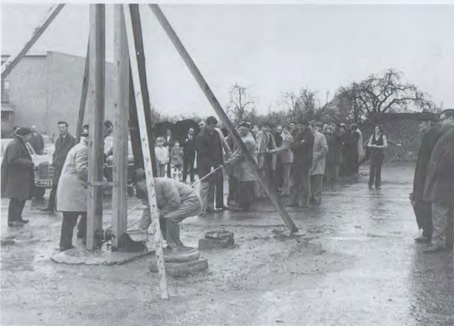
1976. Paasmaandag, de vogelstang wordt neergelaten.