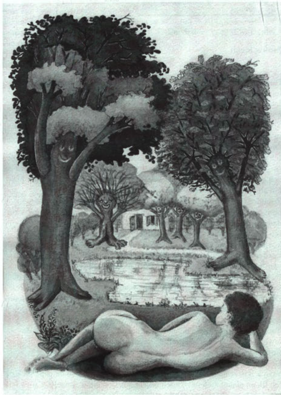
Tekening: Piet Orbons

'r èimaol nève de wiéje sjtèit, zachte tókkelgeluidjes mäoke. Sjtet wie e vuügelke loéster ich wie ze hun èigeste geluide opèin aofsjtömme tot lyrisch tókkelende roésjmeziék.