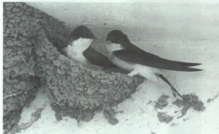
Mannetje en vrouwtje huiszwaluw bij hun bolvormig nest in aanbouw. Als het nest, dat hoofdzakelijk uit klei bestaat, klaar is, blijft er aan de bovenkant nog een kleine vliegopening. Huiszwaluwen bouwen hun nest bij voorkeur onder overhangende delen van daken

Het mannetje winterkoning ("kuüninkske") heeft van het bouwen van nesten een ware hobby gemaakt. Hij bouwt wel vier á vijf nesten van dorre bladeren, mos en grassen, waaruit het vrouwtje uiteindelijk het beste exemplaar kiest. Het vrouwtje zorgt dan wel zelf voor de verdere afwerking van het nest met kleine veertjes, pluisjes en haartjes om vervolgens haar eitjes erin te leggen. Meneer is intussen druk bezig met het versieren van een ander liefje dat hij lokt met zijn prachtig en luid klinkend lied waarna hij haar installeert in een van de andere nesten. De nesten waarin niet wordt gebroed, zijn de zogenaamde "slaap- of speelnesten", waarin het mannetje de nacht doorbrengt. Later, als de jongen zijn uitgevlogen, overnachten deze ook mee in deze nesten. In de stal achter ons woonhuis hebben vroeger altijd boerenzwaluwen gehuisd. De laatste tien jaar hebben ze helaas niet meer gebroed al zijn