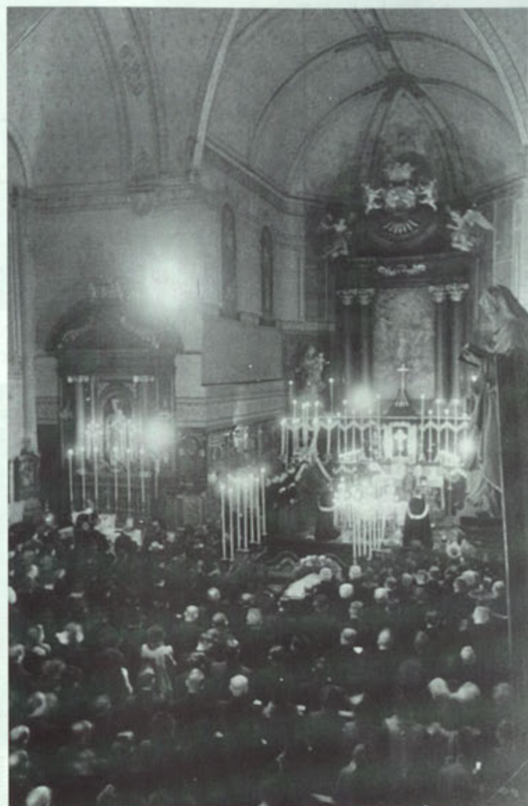
Begrafenisdienst in de kerk van Gronsveld. Kan iemand ons vertellen bij welke gelegenheid deze foto genomen werd?