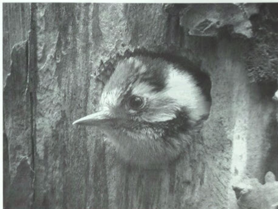
De jonge bonte specht steekt zijn kop uit het veilige boomnest. Een ideaal nest, warm en droog en bestand tegen alle weersinvloeden. De eieren behoeven geen schutkleur en zijn dus wit.

Houtduiven ("wél doéve") maken een simpel boomnest van schijnbaar lukraak gestapelde takjes. Vaak kun je van beneden door de nestbodem heen de eieren zien liggen. Toch blijkt, ook na een flinke storm, dat het nest best stevig is. De minder bekwame architectuur van de hout- en