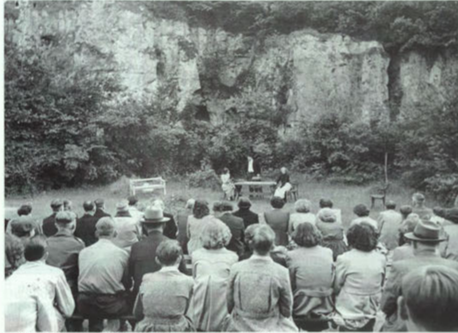
± 1950. Openluchttoneel in de Daolekääomers.