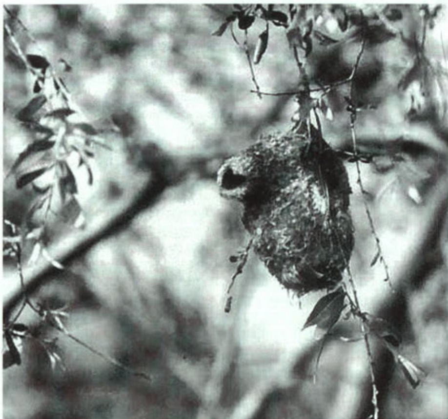
Het prachtige nest van de buidelmees. Dit nest is buidelvormig en bestaat uit zaadpluizen van verschillende bomen. Het nest heeft een invliegopening aan de zijkant en hangt aan het einde van een afhangende tak.

holten. De meeste vogels die in hopen broeden (hopenbroeders) gebruiken weinig nestmateriaal, hooguit wat veertjes of houtschildertjes om de eieren op hun plaats te houden.