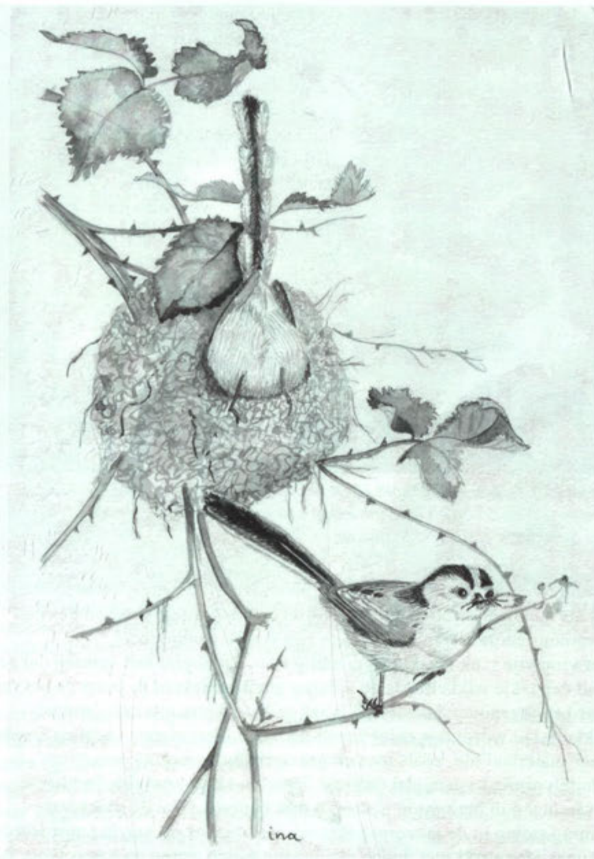
De staartmees maakt een fraai rond nestje van spinrag, schors van berken, en korstmossen. De staartmees maakt dus geen gebruik van natuurlijke holten, zoals andere mezensoorten. De lange staart past niet in het nest zodat deze tijdens het broeden naar buiten steekt.

Bladeren, stengels en takjes vormen in de vogelwereld het voornaamste bouw materiaal. Een aantal soorten vogels gebruikt ook modder en leem. Lijsters werken de binnenkant van hun nest af met modder. Hierdoor ontstaat een mooi glad maar ook een zwaar nest dat stevig in een haag zit.