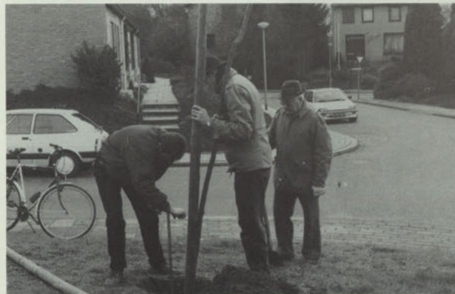
De aanplant van de christusdoorn aan de Vroendalsweg