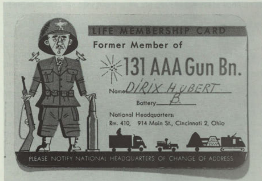
131 Anti Aircraft Artillery Gun Battalion.