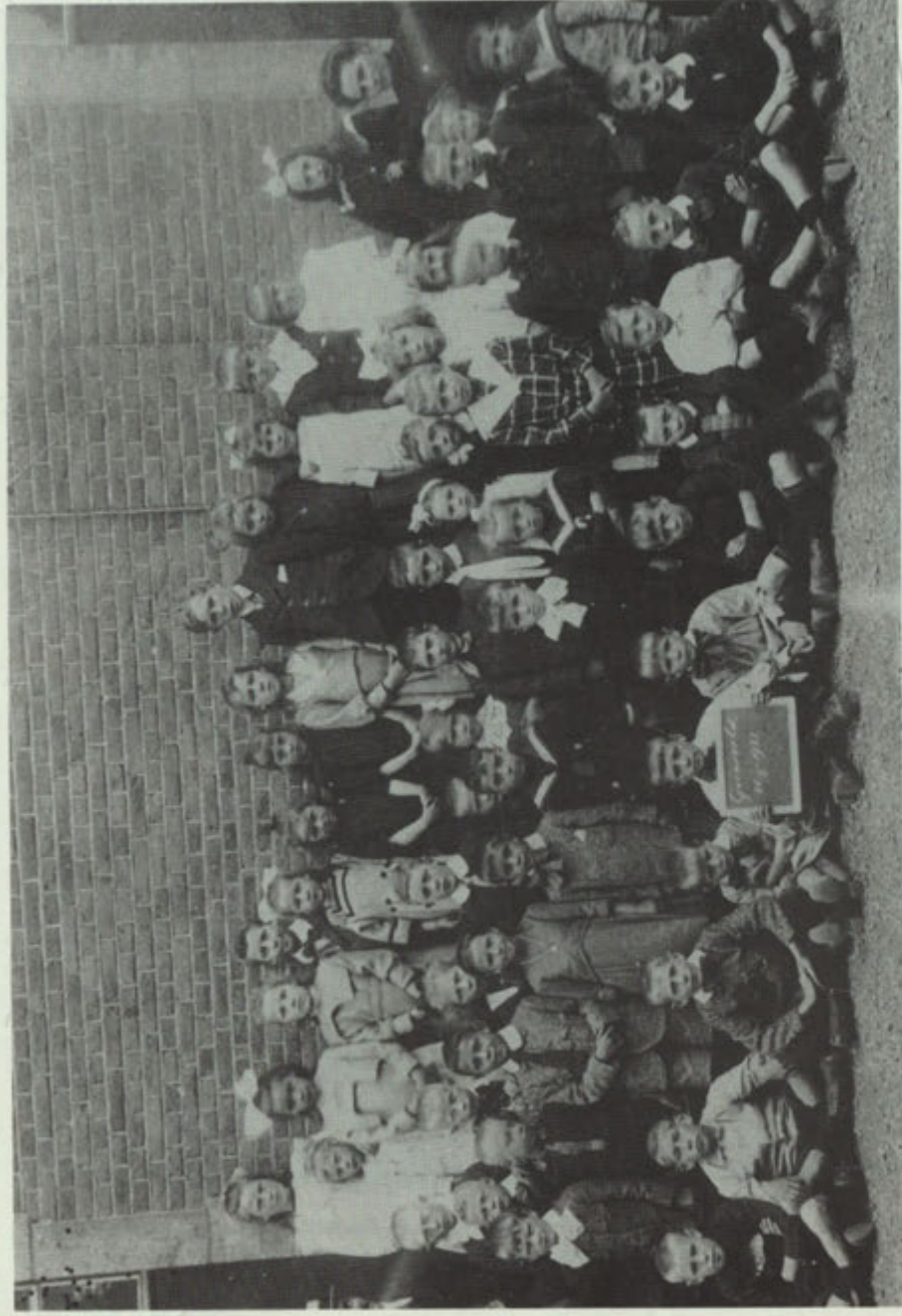
Lagere School Gronsveld 1921