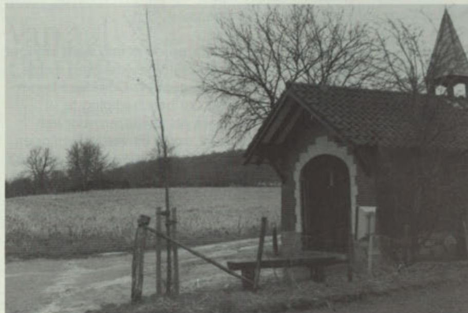
De moseik bij het kapelletje (een geschenk van de RABO-bank)

Bij de heropening van de RABO-bank heeft Grueles aan de bank een boom(bon) geschonken. Deze boom zou worden aangeplant bij de bank, hetgeen niet mogelijk bleek. Het bestuur van de bank gaf ons de (bon) retour met het verzoek hem te gebruiken voor de aanplant van een boom op een geschikte plaats in Gronsveld of Rijckholt. Er werd besloten tot aanplant van een mos-eik nabij het kapelletje (eerlijk verdeeld tussen Gronsveld en Rijckholt). De keuze voor moseik werd mede bepaald doordat deze boom smal en hoog opgaand is zodat hij (in de toekomst) het landbouwverkeer niet hindert. De boom werd ter bescherming voorzien van een rooster en palen.