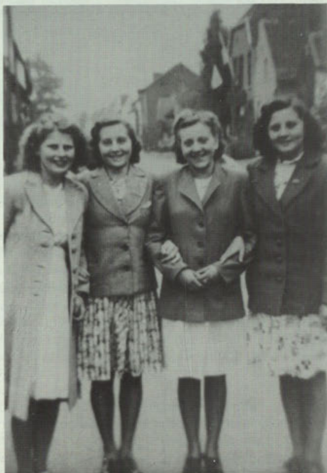
Dit is foto 23