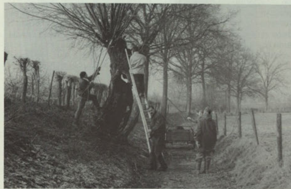
De sectie natuur knot de wilgen in de 'Gröb'

Een van de eerste activiteiten van de sectie Natuur was het knotten van wilgen in Gronsveld en Rijckholt. Als knotbomen niet regelmatig