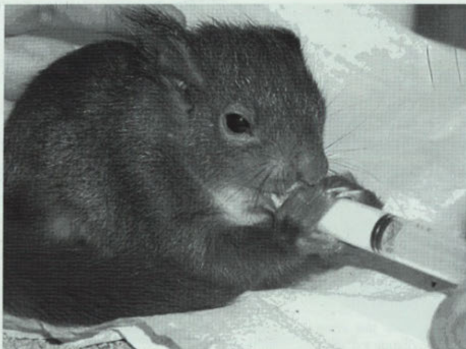
Jonge eekhoorns worden gevoed met speciale melk.

In het voorjaar zijn ze verzot op jonge scheuten van fruitbomen en ze zijn om die reden minder populair bij fruittelers. Ook slakken, kevers, rupsen, paddenstoelen, eieren en zelfs jonge vogels staan op het menu. Het voedsel verorberen ze meestal hoog in een boom waar ze zich veilig voelen. Het zijn uitstekende klimmers die soms van boom tot boom springen. Op de grond bewegen ze zich met korte sprongetjes voort. Bij onraad zoeken ze meteen de dichtstbijzijnde boom op en klimmen aan de achterzijde, vanuit de kijker bezien, omhoog. Zonder zich te verroeren en platgedrukt tegen een stam kunnen ze zich lange tijd verbergen.