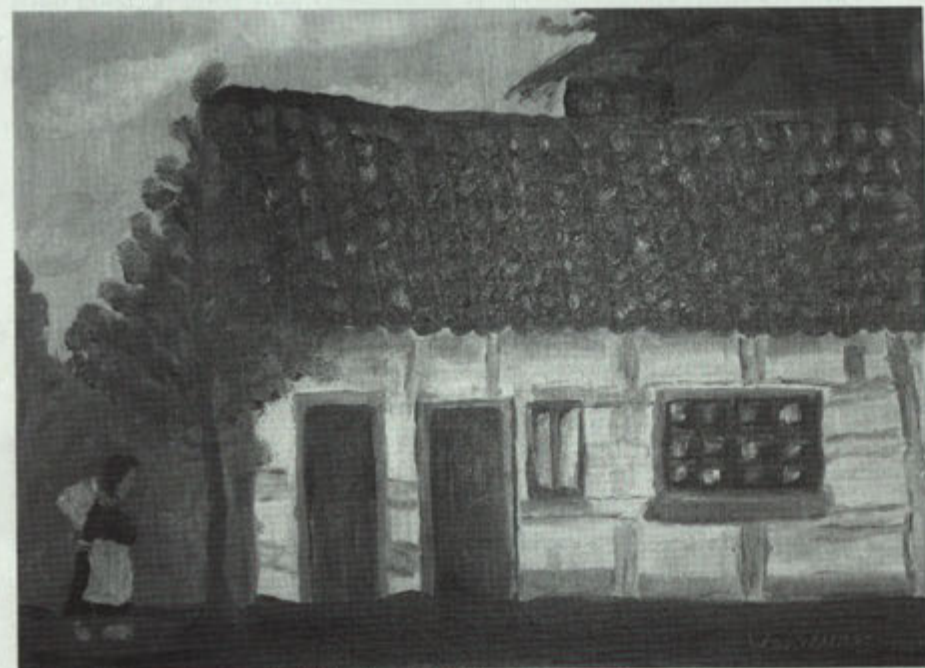
Schilderij van het ouderlijk huis van Trûi.