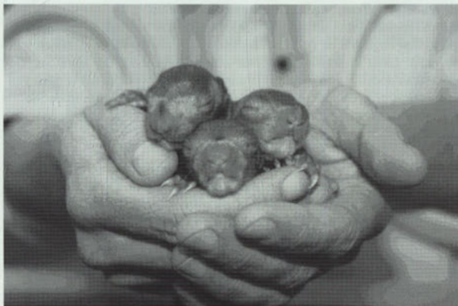
Jonge eekhoorns in handen van het opvangcentrum.

De Nederlandse populatie van de rode eekhoorn is weer aardig uit het dal gekropen. Geschikte gebieden zijn weer voor een groot deel bevolkt. Datzelfde beeld zien we ook terug in onze contreien. Het Savelsbos herbergt weer de nodige eekhoorns, wat te merken is aan het aantal eekhoorns dat het bos verlaat en de meest geschikte gebieden in Gronsveld en Rijckholt weer in bezit neemt. In alle parken, en waar veel tuinen bij elkaar liggen, laten ze zich regelmatig zien. Ze schuwen daarbij de mens niet, al blijven ze wel uiterst voorzichtig en bij de minste onraad