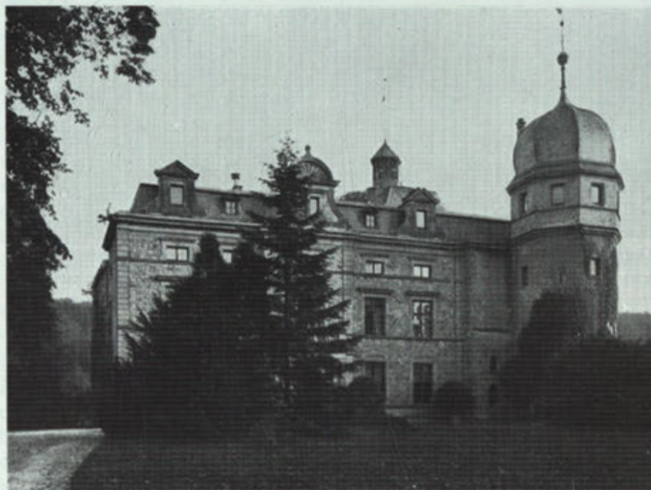
Kasteel Rimburch omstreeks 1900.

Veel kenmerken van de hiervoor genoemde, min of meer algemene, huwelijkspolitiek zijn ook terug te vinden in een aantal huwelijkscontracten die de heren van Gronsveld in de periode tussen ruwweg 1350 en 1500 sloten. Ooit zullen de bezegelde originelen op perkament wel in de bovenste lade van het familiearchief hebben gelegen, maar thans kennen we de inhoud alleen nog maar uit afschriften in een dikke zestiende-eeuwse foliant, die zich in de Landes- und Universitätsbibliothek in Darmstadt (D) bevindt. Deze huwelijks-