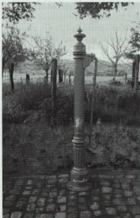
Pomp terug in Rijckholt.