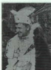
Prins Frans S (1967) 1967