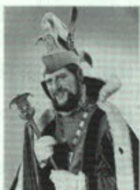
Prins Wil S (1973) 1973