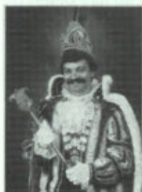
Prins Wil S (1983) 1983