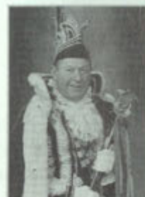
Prins To S (1985) 1985