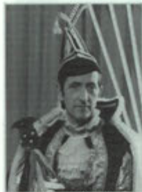
Prins Jan S (1979) 1979