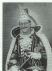
Prins Leon S (1988) 1988