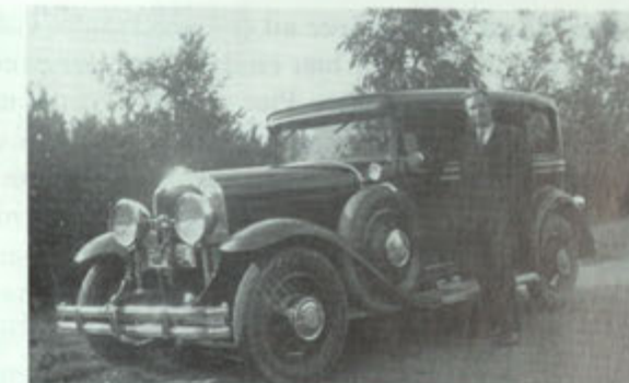
De Sjik en zijn Buick.