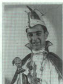
Prins Mathias S (1960) 1960