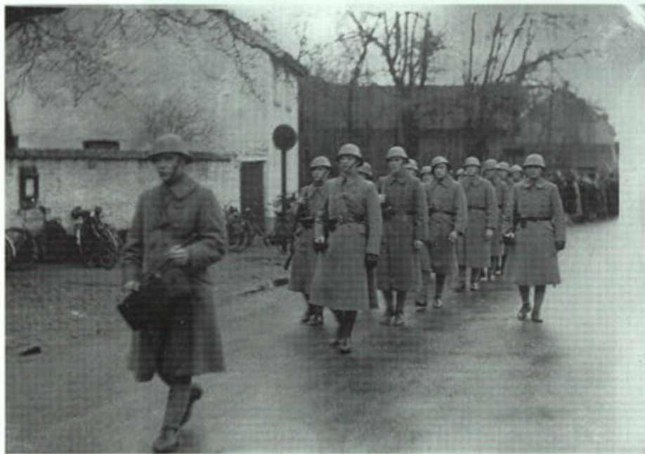
Begrafenisstoet vertrekt vanaf het ouderlijk huis.

Hij werd in Gronsveld met militaire eer begraven.