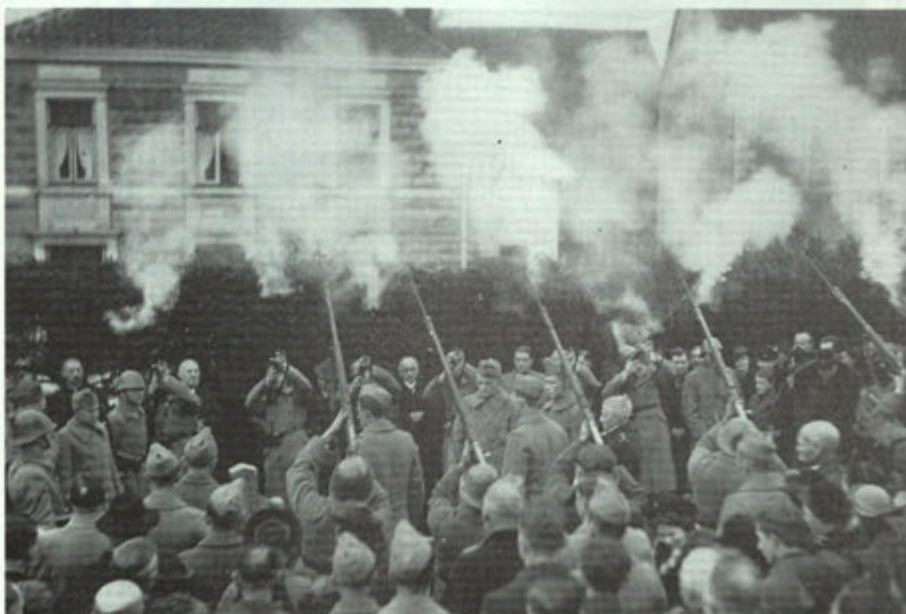
Salvo op het kerkhof.