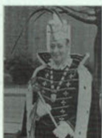
Prins Robert S (1970) 1970