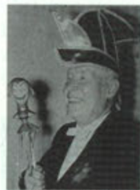
Prins Rex S (1959) 1959