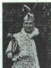
Prins Henric S (1962) 1962