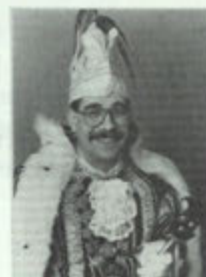
Prins Jan S (1990) 1990