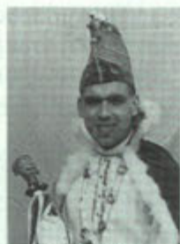
Prins Jo S (1961) 1961