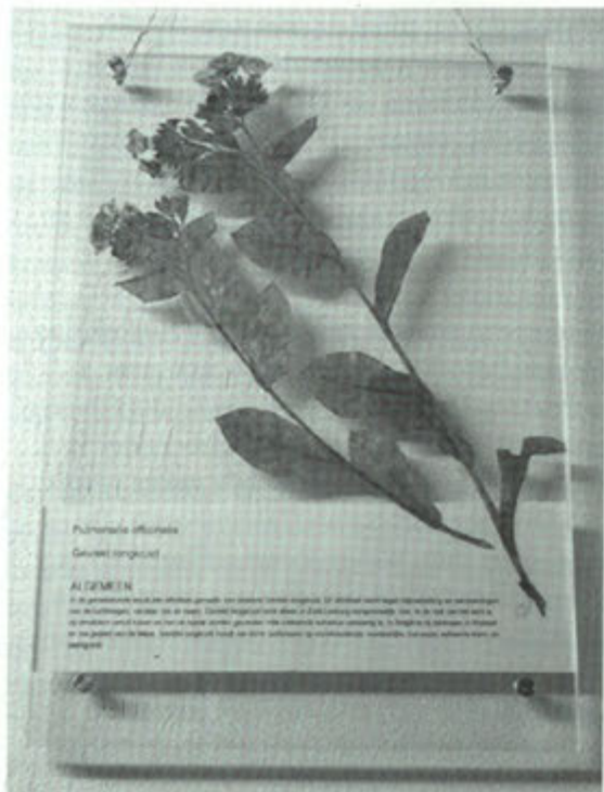
Gedroogd "gevekt longkruid" tussen plexiglas.

vorm" voor "rond" dan schiet de teller naar 63. Zo gingen de kinderen door totdat er slechts één plant overbleef. De leden van de sectie controleerden of het resultaat juist was. Daarna mochten de kinderen de bijpassende tekst printen. Inmiddels waren andere kinderen, meestal dus de jongens, om de beurt bezig met het gereedmaken van het plexiglas. De planten en de teksten werden tussen het glas geplaatst en de platen werden vastgeschroefd. Het resultaat is fantastisch. Ruim 30 wilde planten die in Gronsveld en Rijckholt voorkomen zijn op deze wijze geprepareerd. Binnenkort zal Grueles de planten zeker ergens tentoonstellen zodat u met eigen ogen kunt zien wat kinderen op één dag (met een beetje hulp) kunnen maken. "Het was niet alleen leerzaam maar ook nog leuk", zei een van de kinderen dan ook na afloop enthousiast.