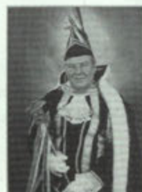
Prins Pieter S (1989) 1989