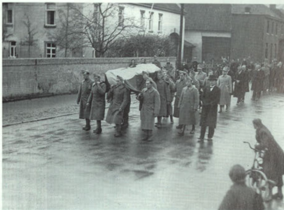
Begrafenisstoet bij Lacroix.