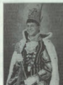
Prins Marcel S (1986) 1986