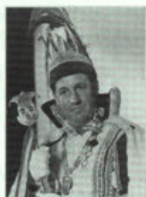
Prins Theo S (1974) 1974