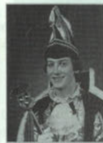
Prins Pieter S (1977) 1977