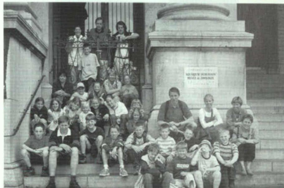
De Jeugd Natuurgroep van Grueles met begeleiders bij de ingang van het museum van de Universiteit van Luik.