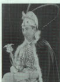
Prins Hendrik S (1969) 1969