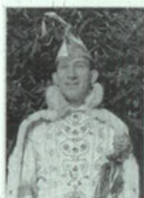
Prins Eddie S (1963) 1963