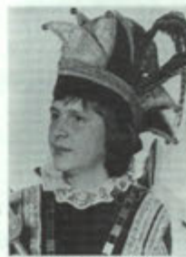
Prins Co S (1976) 1976