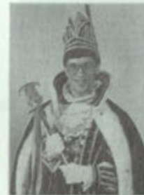
Prins Jo S (1982) 1982