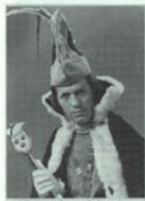
Prins Jan S (1975) 1975