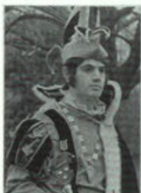
Prins Hal S (1971) 1971