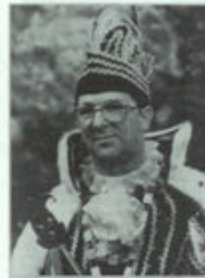
Prins Jof S (1980) 1980