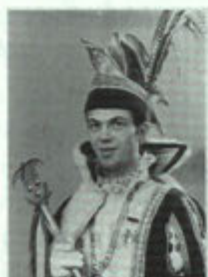
Prins Leon S (1972) 1972