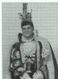
Prins Jo S (1987) 1987