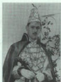
Prins Bert S (1964) 1964