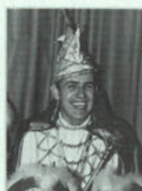
Prins Jan S (1966) 1966