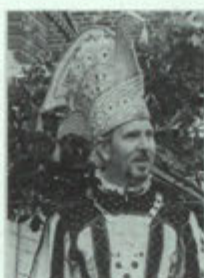
Prins Leo S (1965) 1965