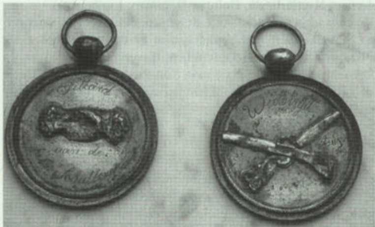
Dit zijn twee van de gewonnen herinneringsmedailles die nu nog aan de kroon van het Sint-Hubertusvaandel hangen, zoals u op de omslag van dit nummer kunt zien.