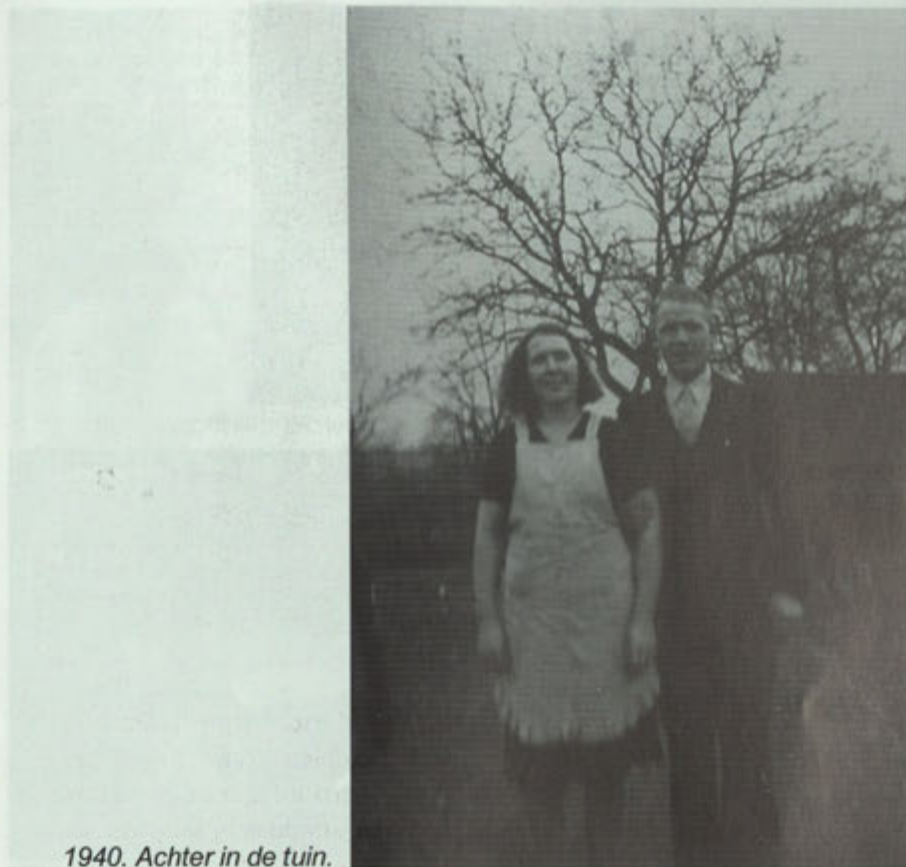
1940. Achter in de tuin.