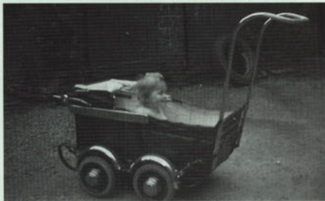
1942. Mia in de gestroomlijnde kinderwagen tussen de antieke staldeuren van Geel Dassen.