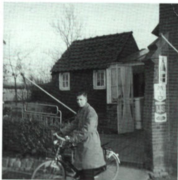
Jean voor de frituur.