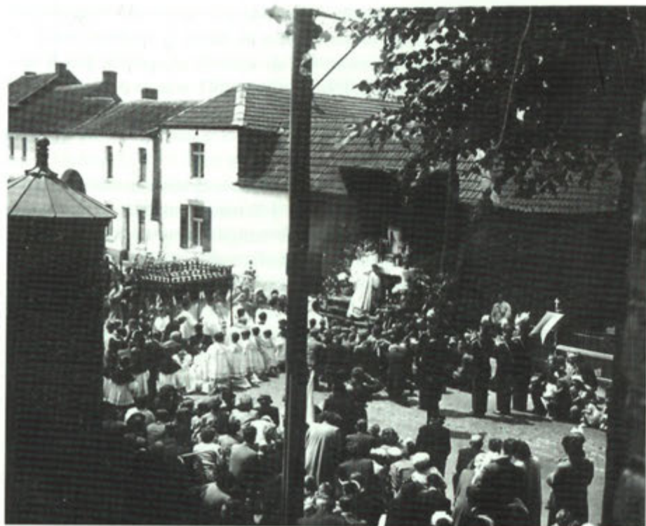
Bronkprocessie in Rijckholt.

het geld te krijgen, waarop hij dacht recht te hebben. Dat dit tot grote strubbelingen moest leiden, laat zich raden. Ook binnen de schutterij waren er wrijvingen. Zo werden vader en zoon Blonden uit Rijckholt, respectievelijk keizer en koning van de schutterij, uit de schutterij gegooid. Verder protesteerden de Rijckholtenaren weer dat de armen van Gronsveld beter uit de armenkas bedeed werden dan die van Rijckholt en dat op Maria Lichtmis (2 februari) toen volgens een oud gebruik kaarsen in de kerk werden uitgedeeld, de Rijckholtenaren werden overgeslagen.