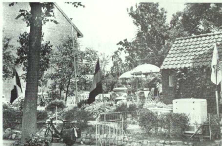
Een blik op de theetuin.