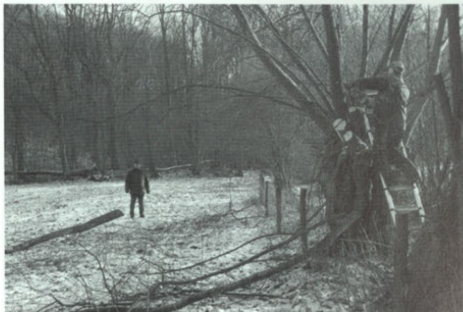
Sectie Natuur knot wilgen in de Daor.

Of en hoe een boom wordt gesnoeid, hangt samen met de soort, de functie en de standplaats. In de fruitteelt en de bosbouw wordt gesnoeid om een goed verkoopbaar product (fruit, hout) te krijgen. Hoewel enkele uitgangspunten voor het snoeien van fruitbomen gelijk zijn aan het snoeien van sierbomen, wil ik opmerken dat het snoeien van fruitbomen een vak apart is en in dit artikel niet expliciet aan de orde komt. Bij onze straat- en tuinbomen hangt de noodzaak tot snoeien voornamelijk van de standplaats af. Belangrijk is een vrije doorgang voor verkeer of het