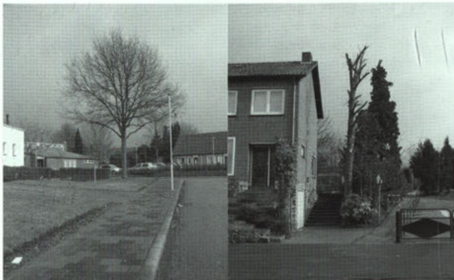
Juiste boom op de juiste plaats.