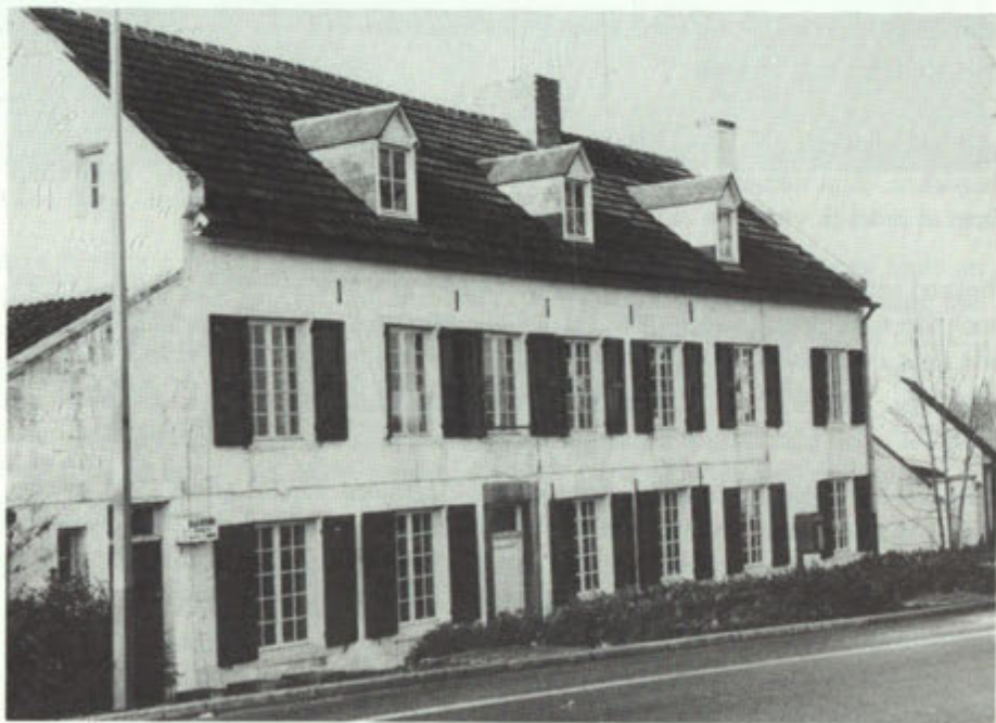
"Bié de Börger".

Het pand gelegen aan de Rijksweg 4 (hoek Trichterweg/Rijksweg) is een van onze blikvangers "oonder ien 't deurp". Het pand, een voormalige boerderij die momenteel bewoond wordt door de familie Pomerantz, is een van de oudste in Gronsveld gelegen woningen. Het statige pand is geheel uit mergelblokken opgetrokken en de voordeur wordt omlijst door Naamse steen. Deze bouwstijl geeft aan dat de woning in de 18e of begin 19e eeuw is gebouwd. Het huis werd vroeger aangeduid als "bié de börger".