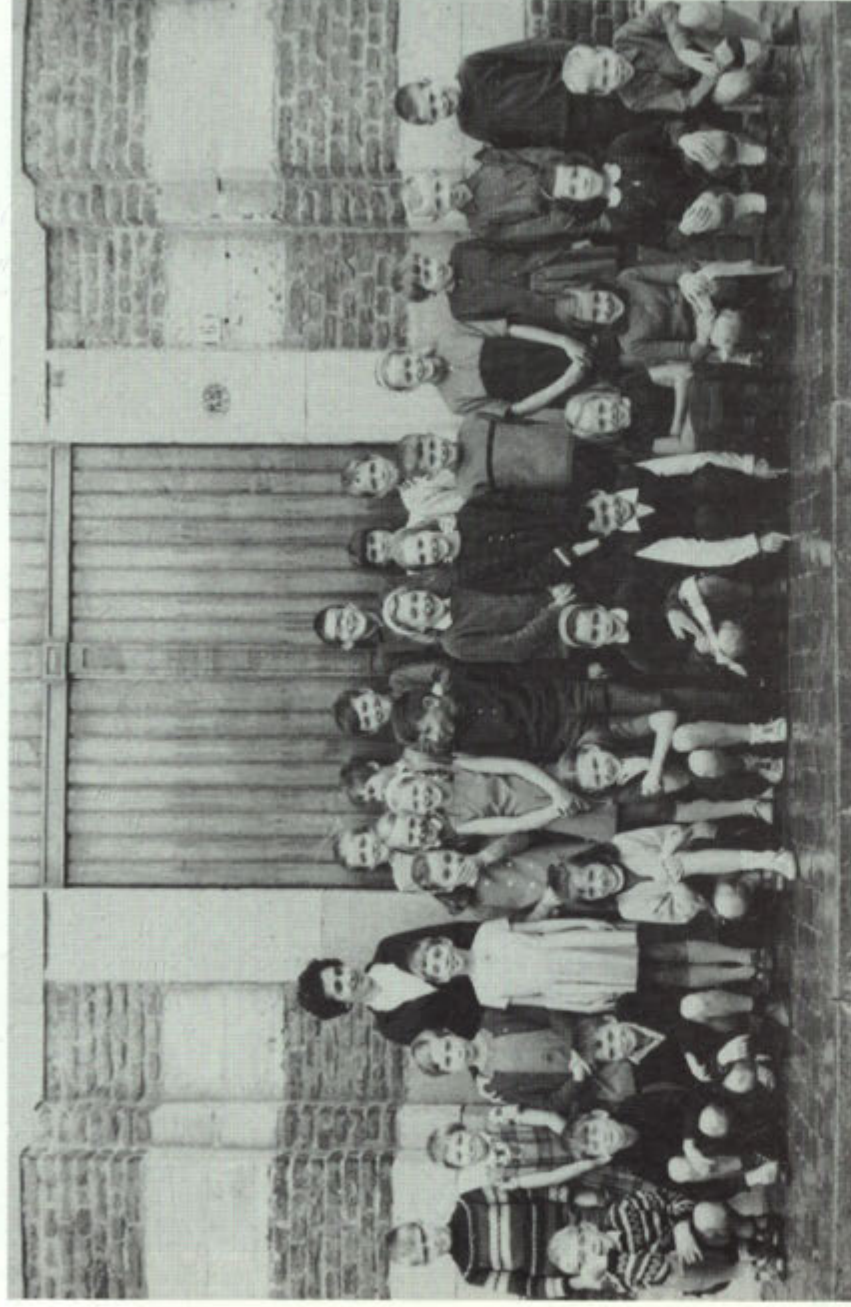
Lagere School Gronsvelt, 1968-1969, vierde klas