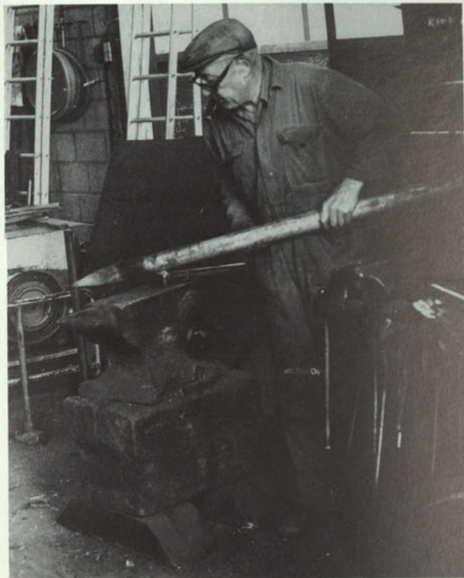
Wöm in zijn "sjmis". Deze foto werd gemaakt twee dagen voor zijn dood.

In de week tussen Kerstmis en Nieuwjaar werden de rekeningen van het hele jaar uitgeschreven. In de dagen na Nieuwjaar kwamen de klanten, meest boeren, betalen. Van die gelegenheid werd dan tevens gebruik gemaakt om weer nieuwe spullen te kopen, hetgeen vervolgens weer een jaar lang bleef "opsjtoen" totdat