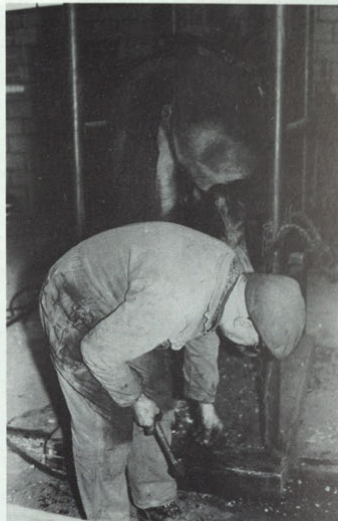
Wöm in de "noetsjtaal".

neutraal opstellen. De klant is koning, zo hield hij zijn kinderen voor. Hoewel hij geen café-ganger was, vond hij dat hij zich als zakenman af en toe in deze gelegenheden moest laten zien. Ieder café in het dorp kon hem op zijn tijd een keer verwelkomen. Als de kinderen tegen nieuwjaar erop uit werden gestuurd om flessen drank te kopen, moesten zij erop letten dat geen café werd overgeslagen. Hoewel de zaken voorspoedig liepen, deed Wöm tegenover zijn klanten alsof het tegendeel het geval was. Als een van de jongens hem dan later vroeg waarom hij zo