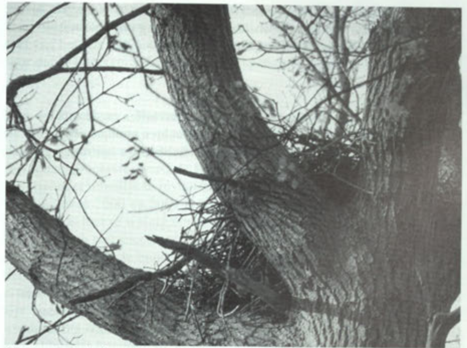
Nest van een buizerd.

De gevonden nesten worden op een kaart ingetekend zodat ze later in het seizoen gemakkelijk terug te vinden zijn. We hebben gemerkt dat je met het intekenen secuur te werk moet gaan, want later in het seizoen, wanneer alle bomen en struiken weer volop in het blad zitten, blijkt het toch een hele klus te zijn om de ingetekende nesten terug te vinden. Vanaf 4 maart werd er 5 ochtenden op uit getrokken om het gehele Savelsbos op oude nesten te controleren. Tijdens de instructiebijeenkomst met Jo Erkens en onze vrienden uit Cadier en Keer werden afspraken gemaakt over wie welk gebied zou inventariseren. De Vereniging tot Natuurbehoud Cadier en Keer nam het gebied ten noorden van de Dorreweg (Daorwëg) voor haar rekening. De Sectie Natuur ontfermde zich over het Savelsbos ten zuiden van de Dorreweg en het Eijsderbos