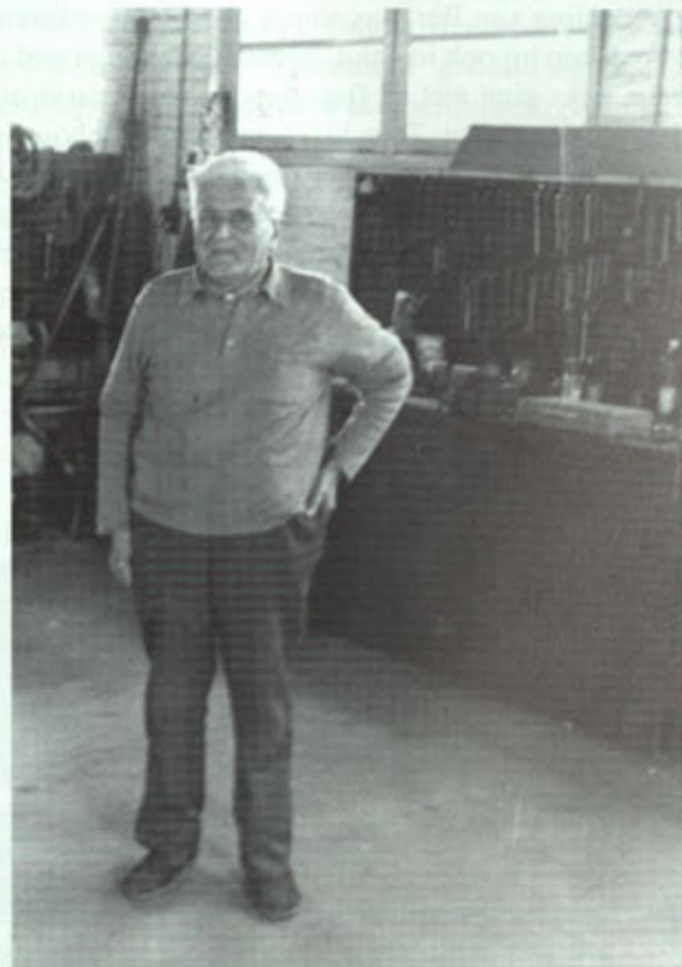
In zijn garage had alles een vaste plek.