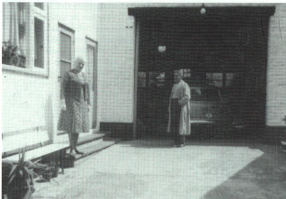
1960. Nêt en Bèr op hun binnenplaats.