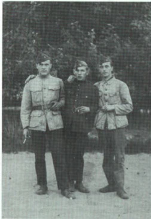
1927. Bèr (links) in militaire dienst.