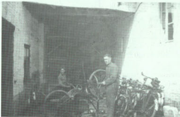
1948. "Op z'n èige, oonder de poért".